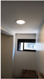
WhatsApp Image 2025-11-07 at 13.49.07.jpeg 53K